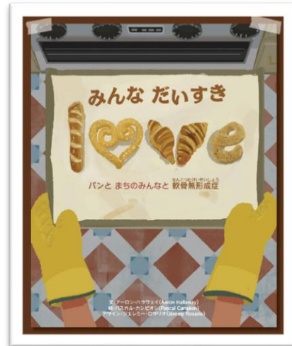
『みんな だいすき』（日本語版）

◎冊子…『軟骨無形成症ってどんな病気？』 可愛らしい動物のキャラクターのイラストが印象的な、 軟骨無形成症について分かりやすく解説した冊子です。